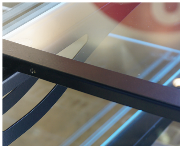
Возможность регулирования угла наклона полки