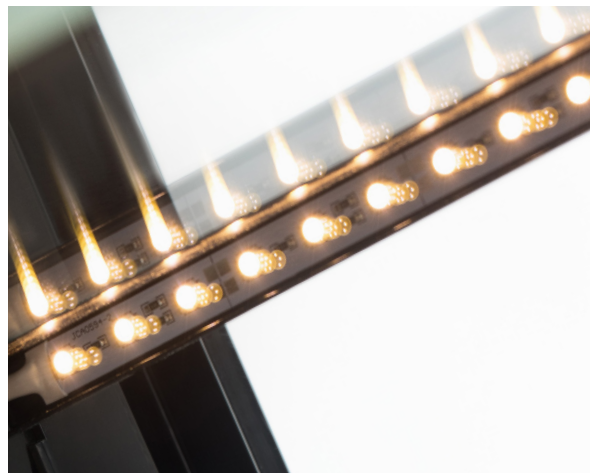
LED-подсветка экспозиции: полок и внутреннего пространства