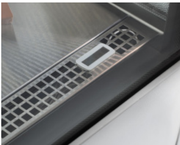
Стабильное поддержание температуры по всему объему и оптимальные условия хранения